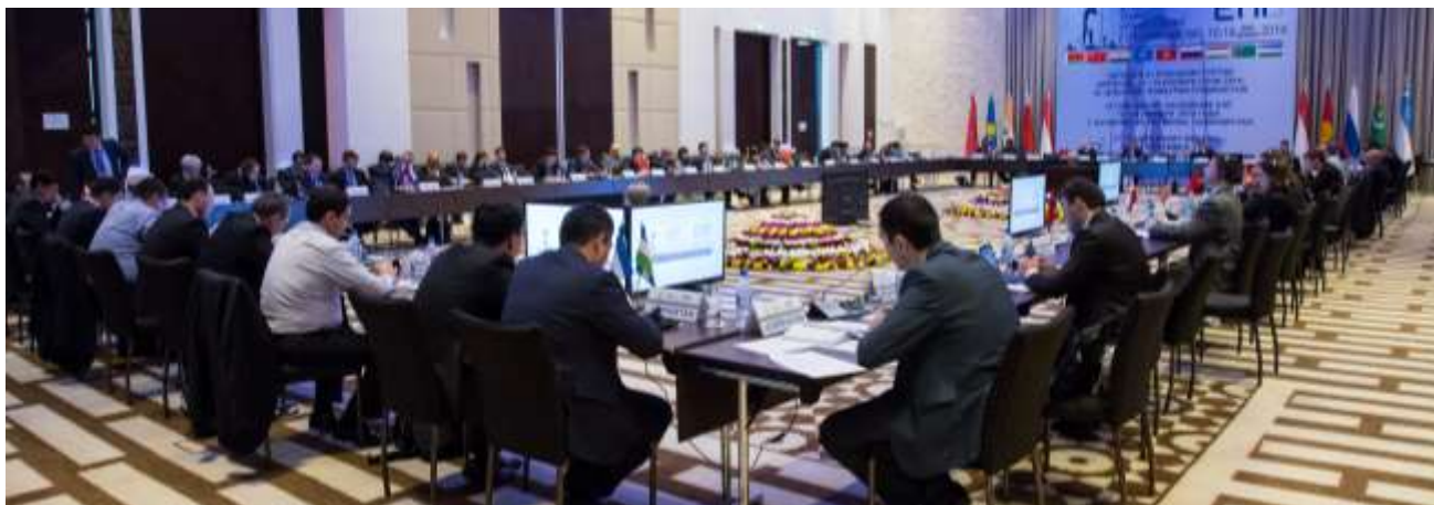
21-е Пленарное заседание и заседания Рабочих групп ЕАГ

В рамках горизонтального обмена опытом между РГТФ в 2014 году достигнута договоренность с Комитетом Совета Европы (МАНВЭЛ) об участии представителя Секретариата ЕАГ в оценке Армении в 2015 году в рамках нового раунда взаимных оценок МАНВЭЛ.