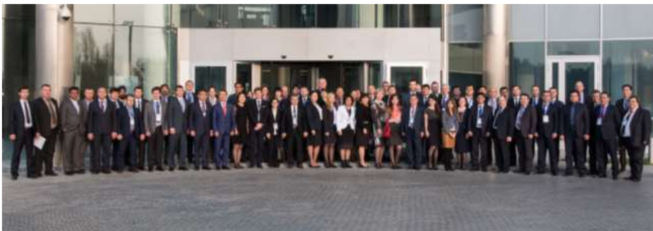
21-е Пленарное заседание и заседания Рабочих групп ЕАГ

Пленарное заседание рассмотрело реализацию программ добровольного соблюдения налогового законодательства в Кыргызстане и Казахстане. Проведенный Секретариатом ФАТФ в отношении Кыргызстана и Секретариатом ЕАГ в отношении Казахстана анализ не выявили нарушения четырех базовых принципов ФАТФ при реализации программ добровольного соблюдения налогового законодательства.