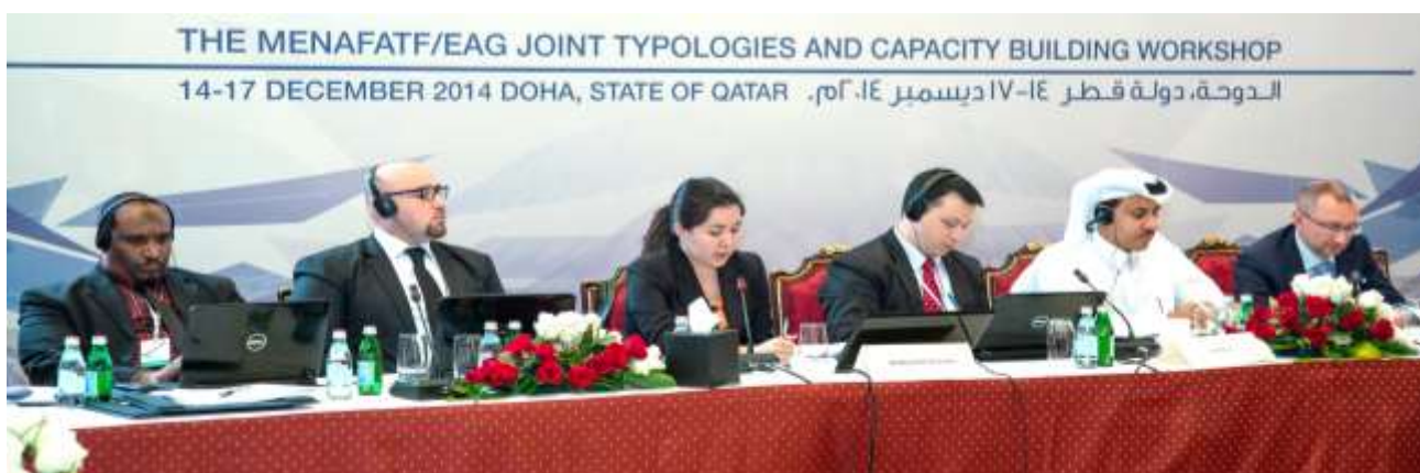
Совместный семинар ЕАГ/МЕНАФАТФ по Типологиям и укреплению потенциала

Бюро Координатора экономической и экологической деятельности ОБСЕ, Управлением ООН по наркотикам и преступности (УНП ООН) и Евразийская группа в