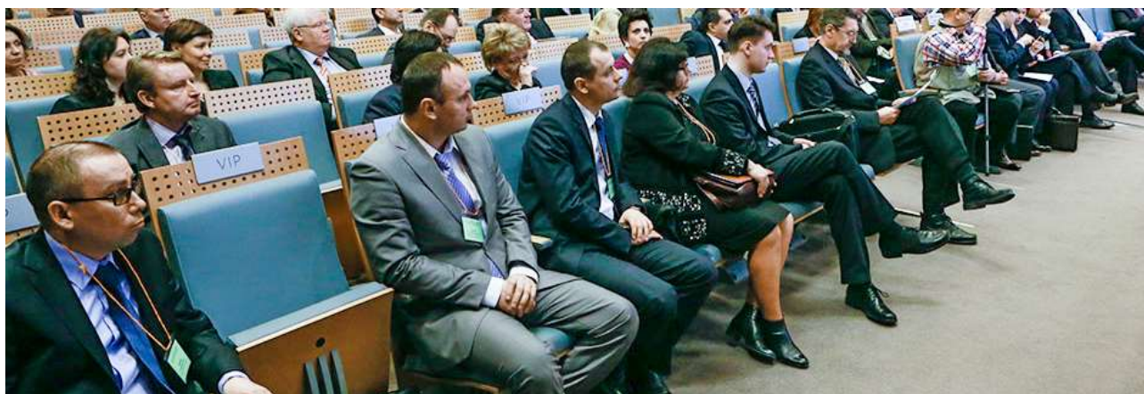
Форум Евразийской экономической комиссии (ЕЭК) «Интеграция финансовых рынков стран ЕЭП: стратегия и тактика»

Представитель Секретариата ЕАГ принял участие в форуме Евразийской экономической комиссии (ЕЭК) на тему «Интеграция финансовых рынков стран ЕЭП: стратегия и тактика». На форуме обсуждались вопросы незаконного перемещения капитала, география и каналы незаконной миграции, имплементация международных стандартов ПОД/ФТ на территории государств-членов ЕЭК.