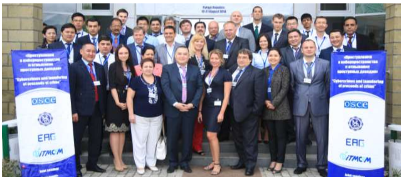
Совместный семинар «Преступления в киберпространстве и отмывание преступных доходов», 19 - 22 августа 2014 г., Кыргызстан

По приглашению АТГ представители Секретариата ЕАГ приняли участие в Типологическом семинаре , который состоялся в ноябре 2014 г. в Бангкоке (Таиланд). В мероприятиях приняли участие 250 делегатов государств-членов АТГ и ФАТФ, представители 8 международных организаций. В ходе форума представлены результаты типологического исследования Евразийской группы на тему « Киберпреступность и отмывание денег ». В 2014 г. утвержден отчет по вышеназванному типологическому исследованию, и его результаты рекомендованы для применения в работе ПФР.