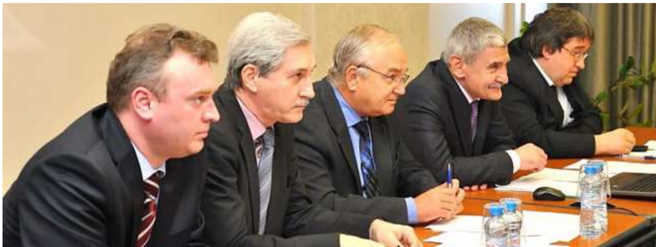
Круглый стол по подготовке кадров в сфере ПОД/ФТ, презентация АО «Финансовая академия» Министерства финансов Республики Казахстан