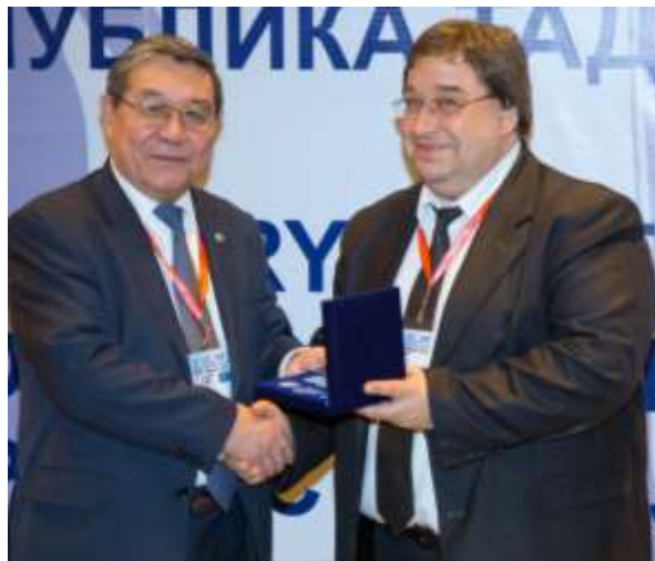
Вручение памятных медалей «10 лет ЕАГ»

На конференции отмечалось, что с момента своего создания Группа преодолела в своем развитии большой путь, проделана большая работа. Во всех государствах-членах созданы правовые основы для функционирования эффективных национальных систем противодействия отмыванию денег и финансированию терроризма, успешно действуют институты финансовой разведки. В Евразийском регионе поступательно развивается отраслевое сотрудничество в сфере ПОД/ФТ.