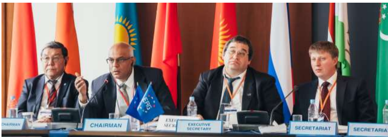
20-е Пленарное заседание и заседания Рабочих групп ЕАГ

В центре внимания участников заседания был мониторинг по итогам первого раунда и подготовка ко второму раунду взаимных оценок национальных антиотмывочных систем государств-членов Евразийской группы. С отчётами о прогрессе в развитии национальных систем противодействия отмыванию денег и финансированию терроризма (ПОД/ФТ) выступили эксперты из Казахстана и Кыргызстана. На мероприятии также были рассмотрены расширенные отчеты о прогрессе Беларуси и Таджикистана в рамках снятия государств с мониторинга ЕАГ.