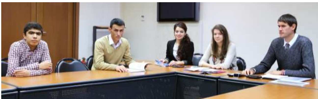
Использование системы ВКС в образовательном процессе студентов сетевого Института

В процессе обучения студентов в ИФЭБ МИФИ была успешно задействована система видеоконференцсвязи ЕАГ, оператором которой является МУМЦФМ. Благодаря возможности использования ВКС в мероприятиях по защите квалификационных работ выпускников ИФЭБ МИФИ приняли участие главы ПФР иностранных государств, которые получили возможность оценить уровень подготовки своих будущих специалистов и их компетентность в вопросах ПОД/ФТ.