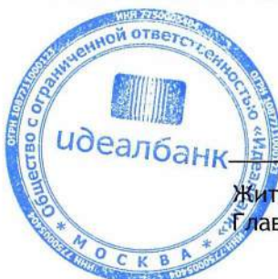
Житарева М.Б., Главный бухгалтер

Примечания на страницах с 11 по 50 составляют неотъемлемую часть данной финансовой отчетности.