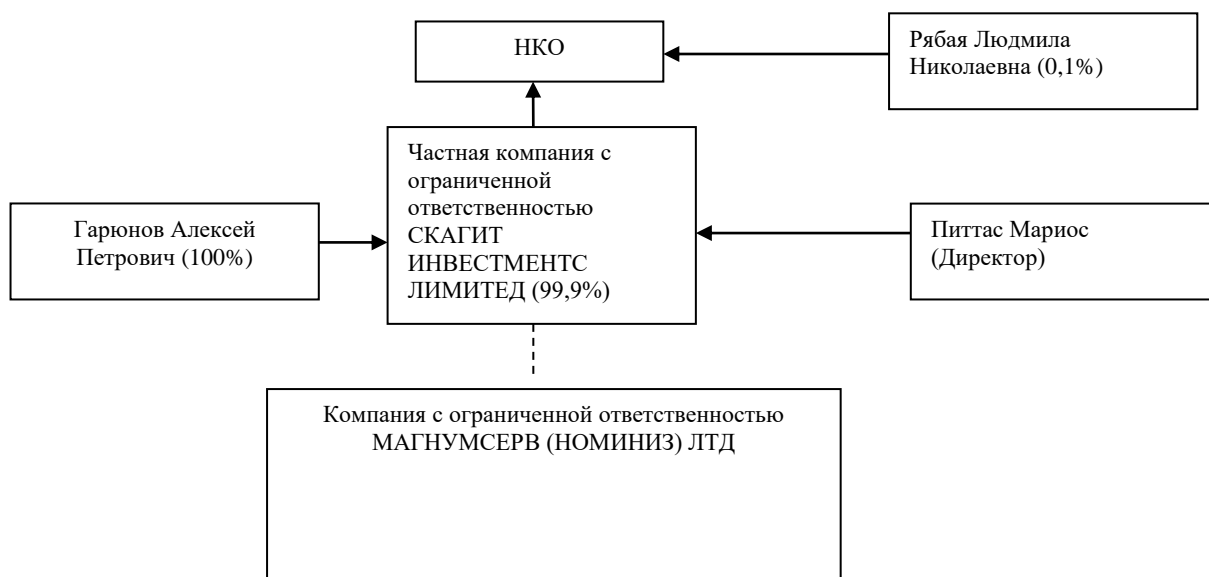
Рисунок 1 – Характер взаимосвязей между учредителями (участниками).

В соответствии со ст. 4 Федерального закона «О банках и банковской деятельности» участники НКО составляют группу лиц, имеющую возможность оказывать прямое влияние на решения, принимаемые органами управления НКО. Характер взаимосвязей между учредителями (участниками) НКО представлен схематично на рисунке 1.